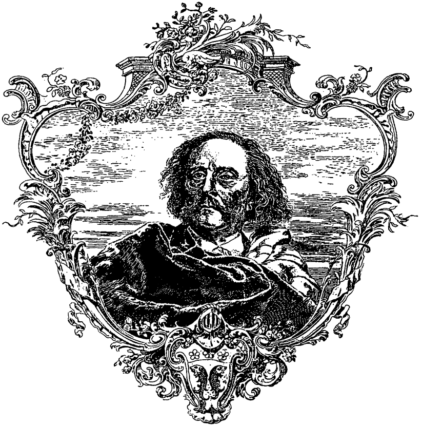
Jules Barbey d'Aurevilly