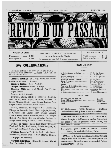
La Revue d'un Passant , n° 33, février 1896.