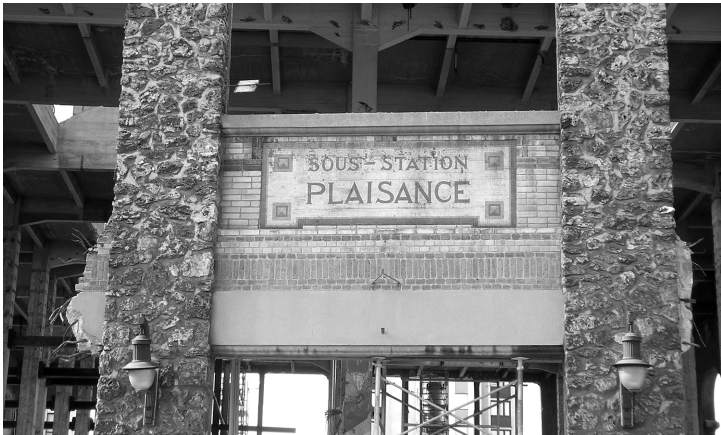
Vestige actuel de la façade de la sous-station de la Compagnie parisienne de distribution d'électricité de Plaisance, 170, rue Losserand (anciennement rue de Vanves).